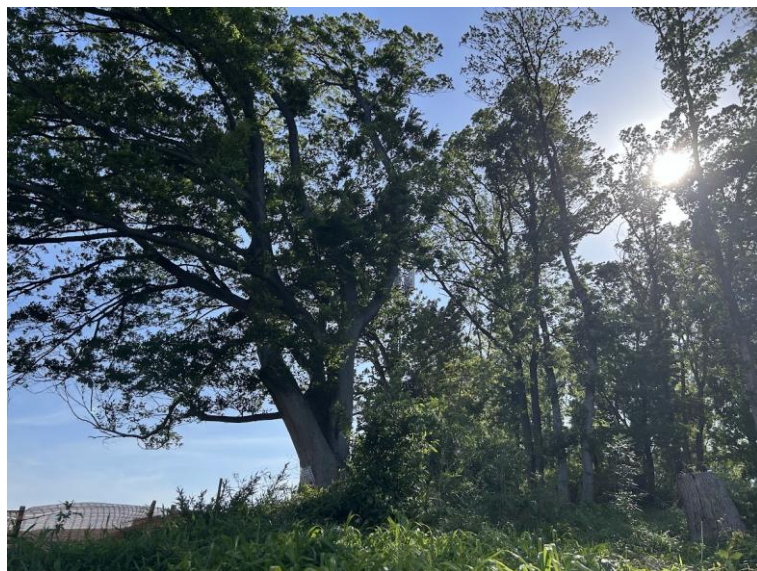
トトロの森56号地・エノキの大木

トトロの森56号地は2020年に東村山市から、「この緑地を守りたいけれど、市では当面の予算がなくトトロのふるさと基金で取得を検討してもらえないか」という相談があったことから始まりました。当基金は東村山市の緑地保全への思いを信頼して、市民や企業の皆さんの寄付金により地権者の方からこの森を買うこととし、2021年11月1日トトロの森56号地が誕生しました。