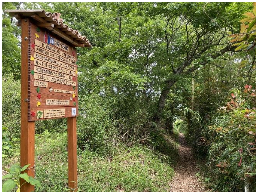
トトロの森56号地の看板と森の小道

東村山市多摩湖町にある「トトロの森56号地」を知っていますか？ 公益財団法人トトロのふるさと基金が貴重な自然として市民や企業の皆さんからの寄付金により取得し保全している森です。今、この森と東村山市道との境に生えるエノキの大木を伐採・伐根し森の小道を消失させる道路拡幅計画が進められています。