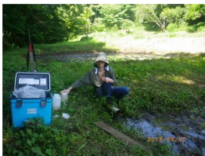
写真 1 採水風景