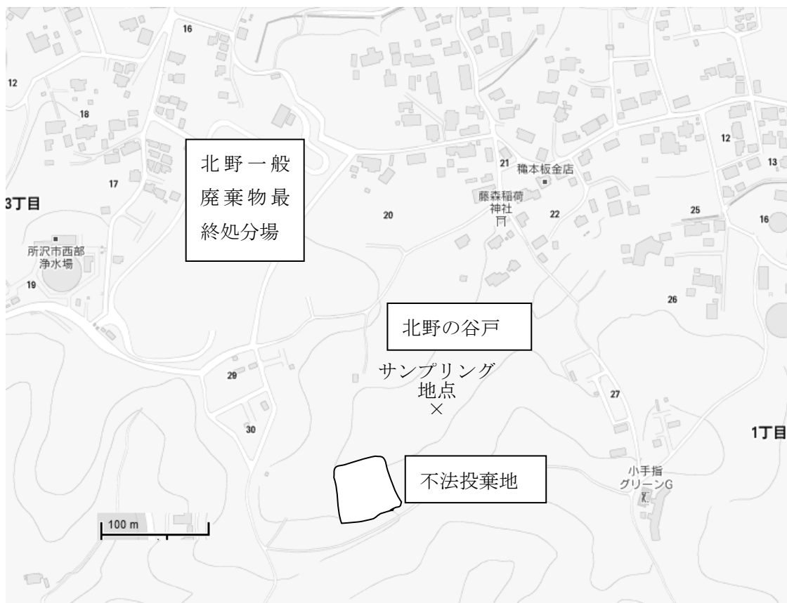
図 1 調査地点